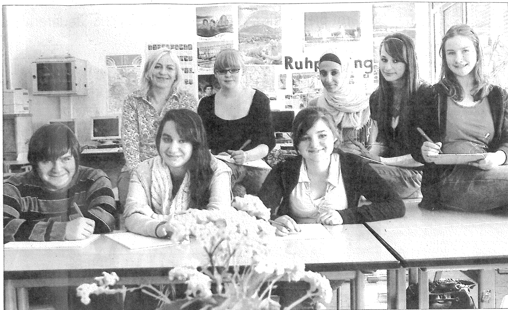
Die Deutsch-geht-gut-Schreibwerkstatt an der Sandschule fing mit Reiseerzählungen an.